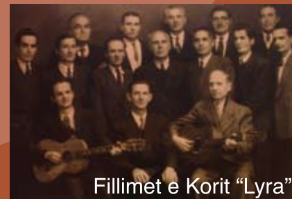
Fillimet e Korit "Lyra"