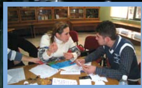
Të rinjtë gjatë trajnimit