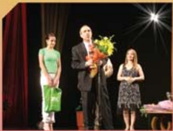
Vladimir Topi - skulptor