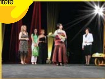
Zhuljeta Sheremeni - soprano