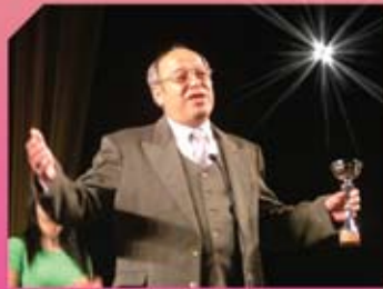
Petrika Riza - aktor