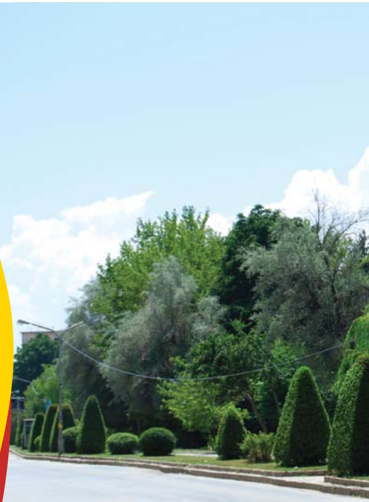
Fotoja e muajit: Parku i qytetit Autori: Keti Tërova

Bashkë me fotot dërgoni dhe një përshkrim të shkurtër të fotos dhe pse e keni zgjedhur pikërisht atë.